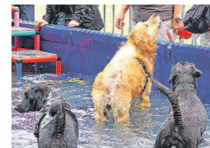
Ein kühles Bad mag (fast) jeder Hund.

An beiden Tagen findet ein buntes Showprogramm rund um den Hund statt. Dabei werden unter anderem Hunderassen und -initiativen vorgestellt. Auf Ausläufflächen und im Swimmingpool kann Ihr vierbeiniger Begleiter Abwechslung finden. Außerdem kann er sich sogar bei einem Talentwettbewerb beweisen.