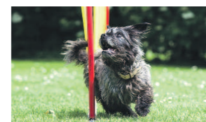
... und wer stellt sich auf dem Hunde-Parcours am geschicktesten an?

Die Jury und das Publikum wählen dann die drei Erstplatzierten. Der Wettbewerb „Hundetalent 2018“ findet am Sonntag, 24. Juni, ab 12.45 Uhr statt. Die Darbietung sollte maximal eine Länge von vier Minuten haben. Von der Dogge bis zum Chihuahua, von jung bis alt, können sich alle bewerben. Da die Teilnehmerzahl begrenzt ist, bitten wir Sie, sich mit dem entsprechenden Anmeldeformular anzumelden. Die Teilnehmer des Wettbewerbs werden schriftlich über die Teilnahme informiert. Anmeldungen werden bis zum 15. Juni 2018 entgegengenommen. Das Anmeldeformular können Sie per E-Mail an info@freunde-hauptstadtzoos.de anfordern.