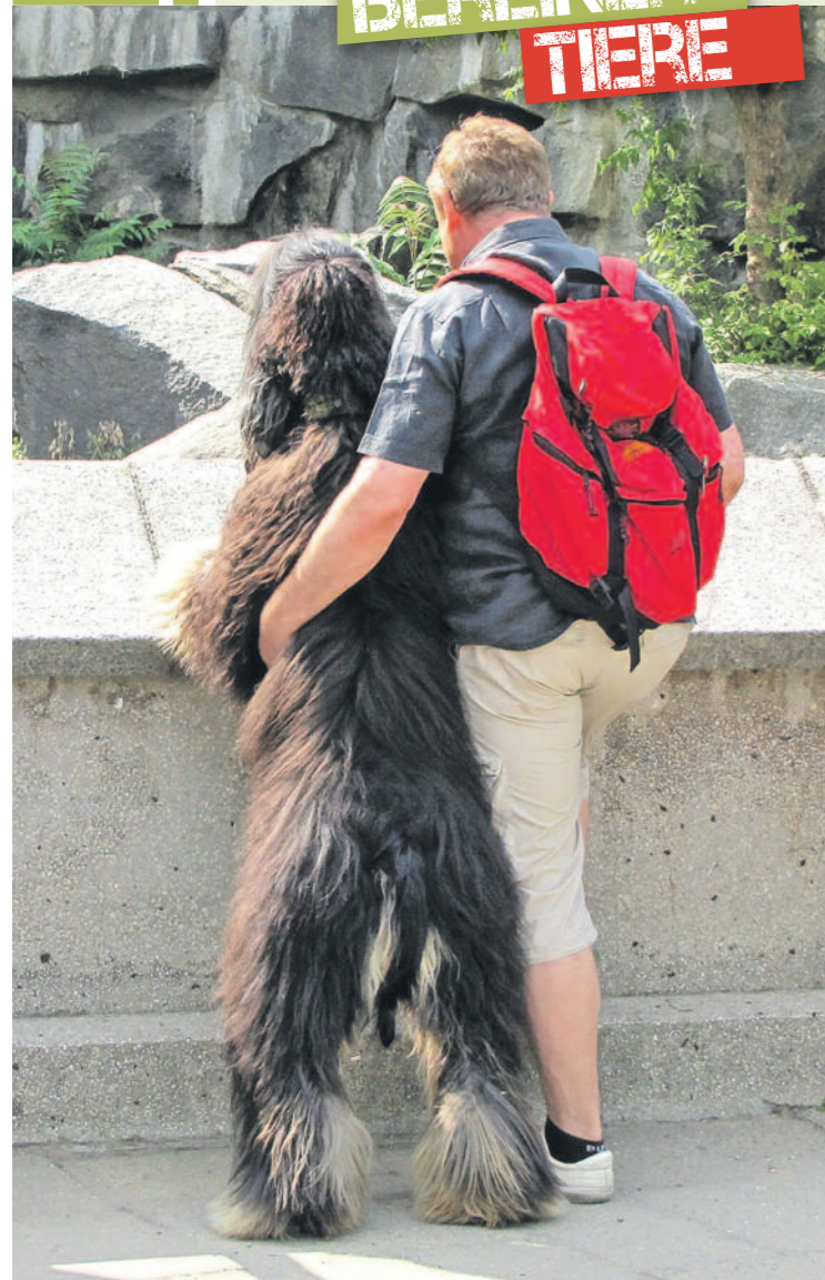
Hunde haben im Tierpark immer freien Eintritt. Nutzen Sie aber besonders auch den Hundetag, um zu entdecken, was sich in dieser tierischen Oase in den letzten Jahren schon alles verändert hat. Sie werden staunen!