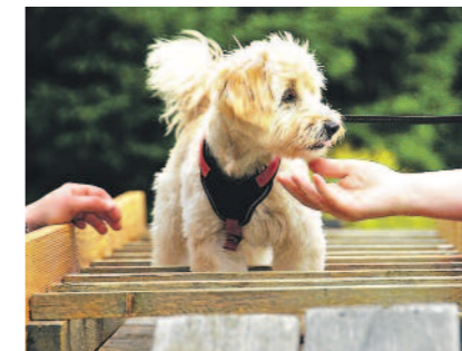
Wer wird das Hundetalent 2018 ...